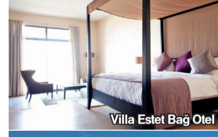
Villa Estet Bağ Otel

■ Urla Bağ Evi Taş ev olarak tasarlanan Urla Bağ Evi, mahremiyetin ve konforun ön planda olduğu 6 odasıyla hizmet veriyor. Zeytin ağacının süslediği restoranında yemeklerin tadını çıkarıp bahçesinde doğayı dinlemeye zaman ayırın. @urlabagevi