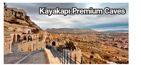
Kayakapı Premium Caves

■ Sunulus Bağ Evi Kayseri'de 2 bin 500 dönümü kapsayan Arif Molu Çiftliği'nin ev sahipliği yaptığı Sunulus Bağ Evi, misafirleri bir çiftlik konseptinde ağırlıyor. Burada doğayla iç içe yürüyüş yapılabilir, bağdaki çalışmalara katılabilir, bisiklet ve yoga etkinliklerinden yararlanabilirsiniz. @sunulusvineyardhouse