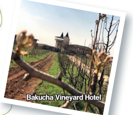
Bakucha Vineyard Hotel

Daha önce hiç bağbozumuna gittiniz mi bilmiyorum ama ben o asmaların arasında dolaşırken kendimi yüzyıllardan beri devam eden bir geleneğin parçası gibi hissediyorum. Üzümün bereketli topraklarda yeşermesiyle başlayan yolculuğuna şahit olurken doğanın mucizesini yaşamamın sevinci doluyor içime. Her annın tadını çıkarabilin diye önerim günübirlik bir tur yerine bir bağ otelinde kalmanız. O sebeple bu hafta İstanbul'dan yola çıkıp bağların izinde yol alırken konaklamanız için en güzel bağ otellerini derlediğim bir liste hazırladım.